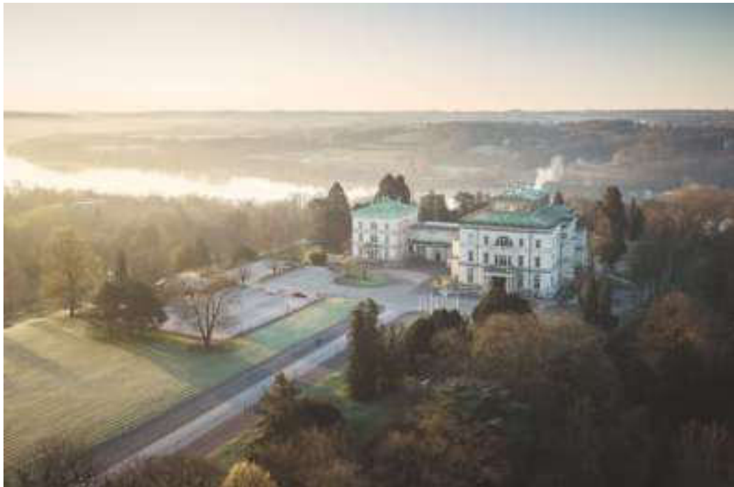
1. Ausflugsziel am 5.Mai: Villa Hügel & Baldeneysee